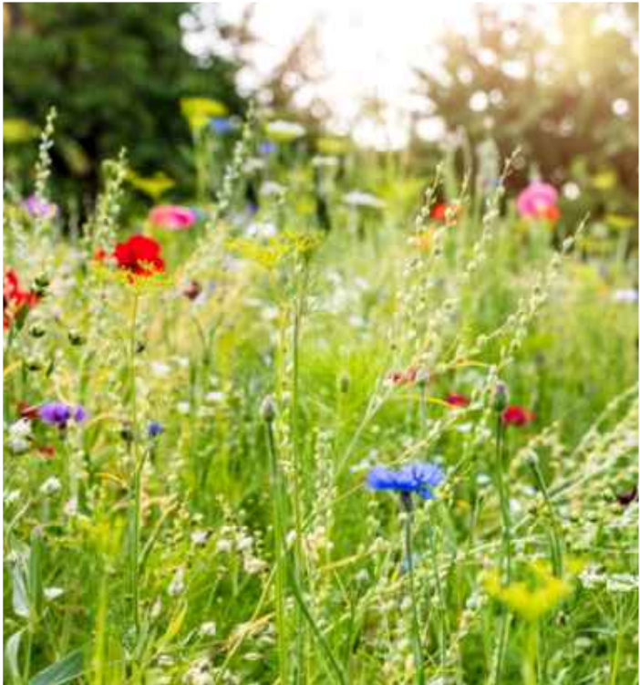
Extenzivní trávník - referenční foto